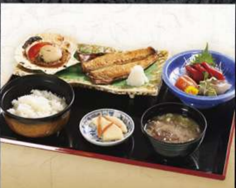
お刺身・焼魚御膳 1,650円(税込)