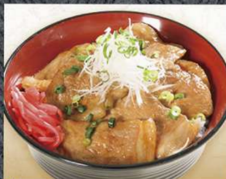
つがる豚丼 1,100円(税込)