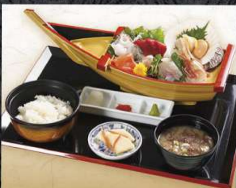
大漁舟盛御膳 2,200円(税込)