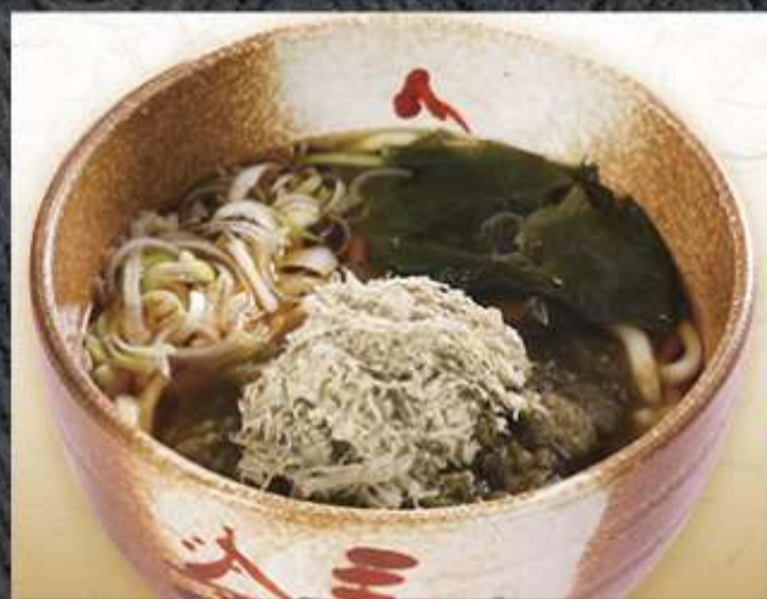
とろろ昆布そば 770円(税込)