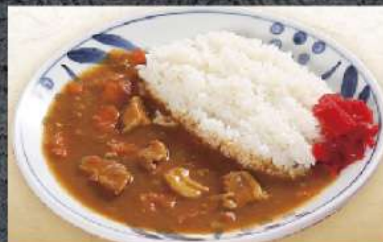
カレーライス 660円(税込)