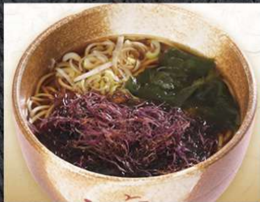
ふのりそば 770円(税込)