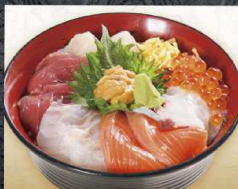
義経丼 〈まぐろ・ほたて・サーモン たこ・鯛・いくら・うに〉 1,870円(税込)