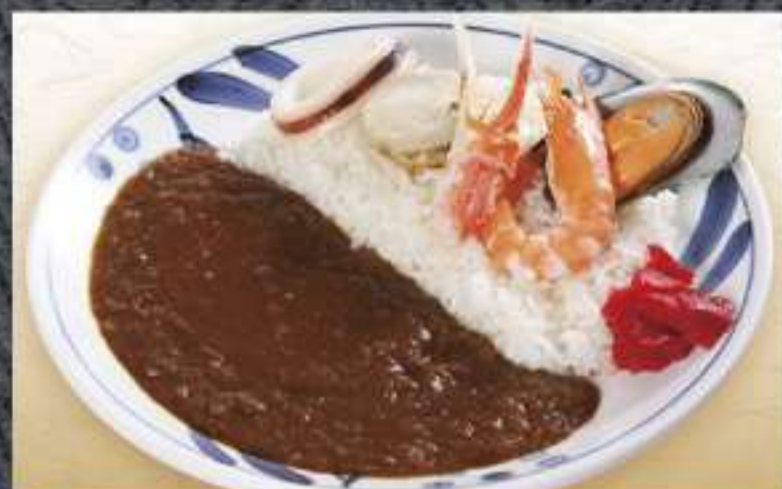
海峡カレー 1,100円(税込)