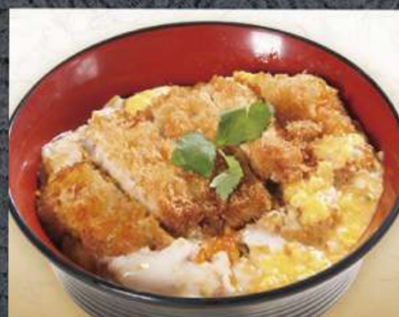
つがる豚かつ丼 1,100円(税込)