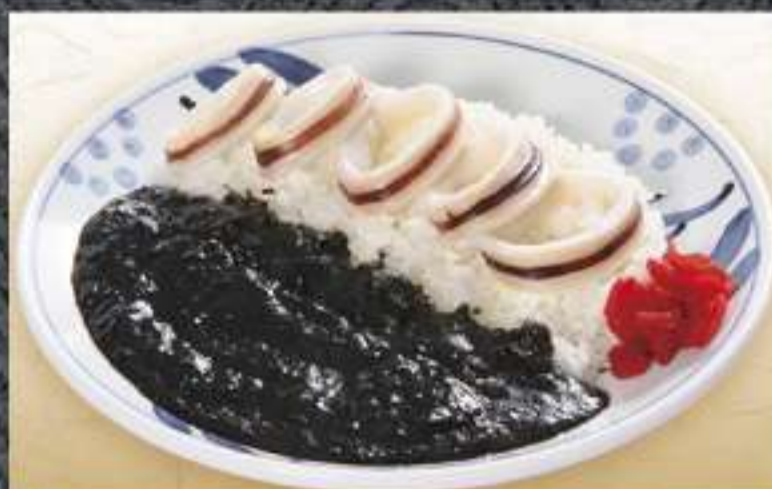
烏賊墨カレー 880円(税込)