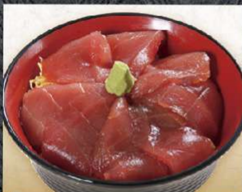
まぐろづけ丼 1,320円(税込)